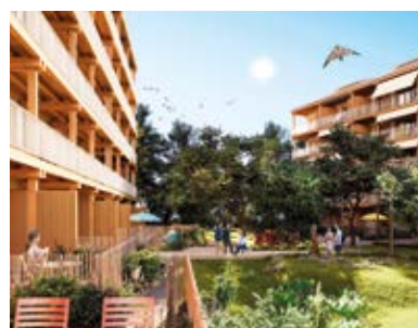
WHOOD - Écoquartier Villefranche-sur-Saône