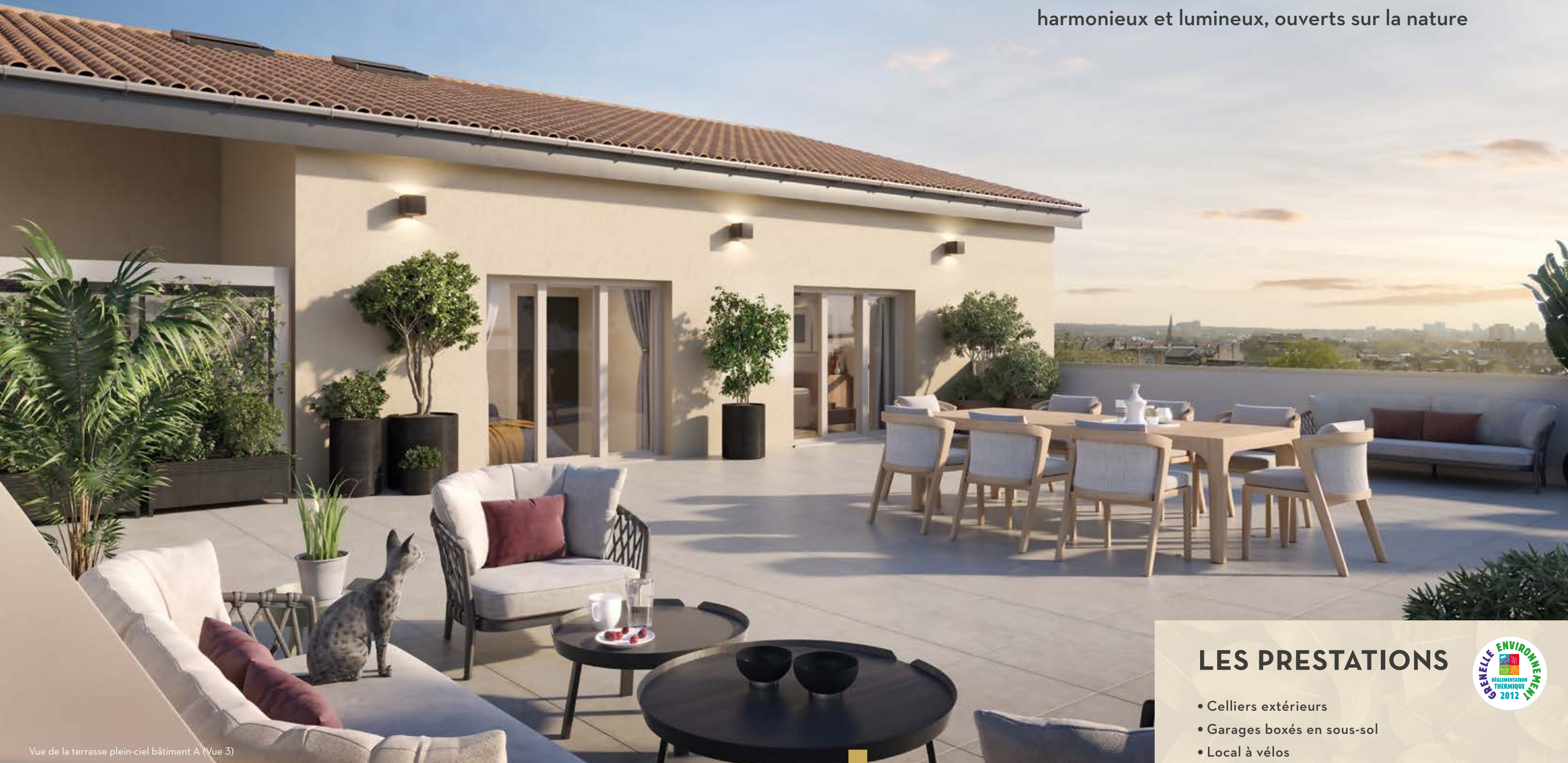
Vue de la terrasse plein-ciel bâtiment A (Vue 3)