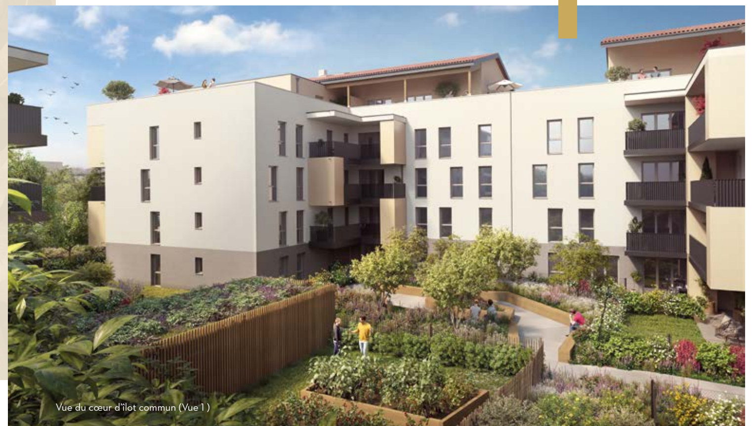
Vue du cœur d'îlot commun (Vue 1)