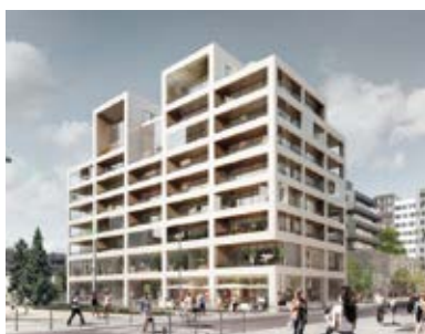
LES LOGES DE SAÔNE Lyon 2 e

Retrouvez l'ensemble des autres programmes réalisés et en cours sur le site : www.fontanel-immobilier.fr