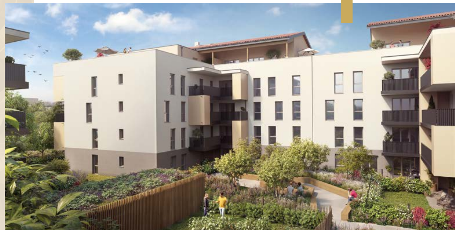
Vue du cœur d'îlot commun (Vue 1)