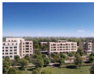
WHOOD - Écoquartier Villefranche-sur-Saône